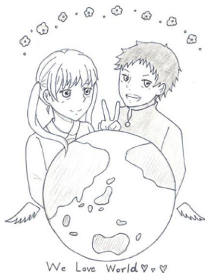
Ilustración elaborada por una estudiante de la secundaria superior de origen brasileño.