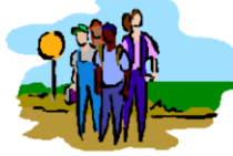
សាលារដ្ឋរៀនក្រៅម៉ោង